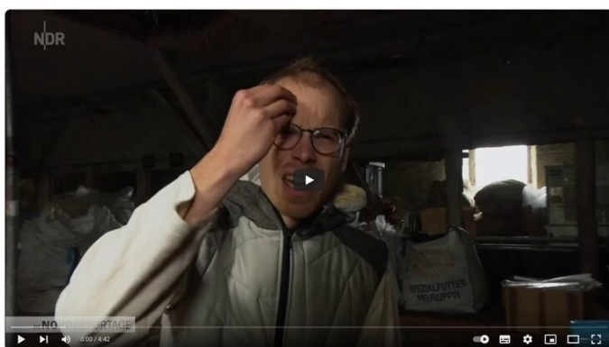
Marco braucht keine Umnutzung sondern Platz und macht eine Ansage

Der Referentenentwurf zur Verkehrsunternehmensdatei-Durchführungsverordnung (VUDAT-EV-E) führt zu massivem bürokratischen Mehraufwand in Form von Meldepflichten für den Busmittelstand. Laut Entwurf müssen sowohl der Beginn als auch das Ende des Einsatzes eines neuen Fahrzeugs sowie die Anzahl der Mitarbeiter gemeldet werden. Statt eine Schnittstelle zwischen den Länderbehörden und dem BALM zu schaffen, verlagert der BMDV die Verantwortung auf die Busunternehmen. Von Bürokratieabbau kann hier keine Rede sein.