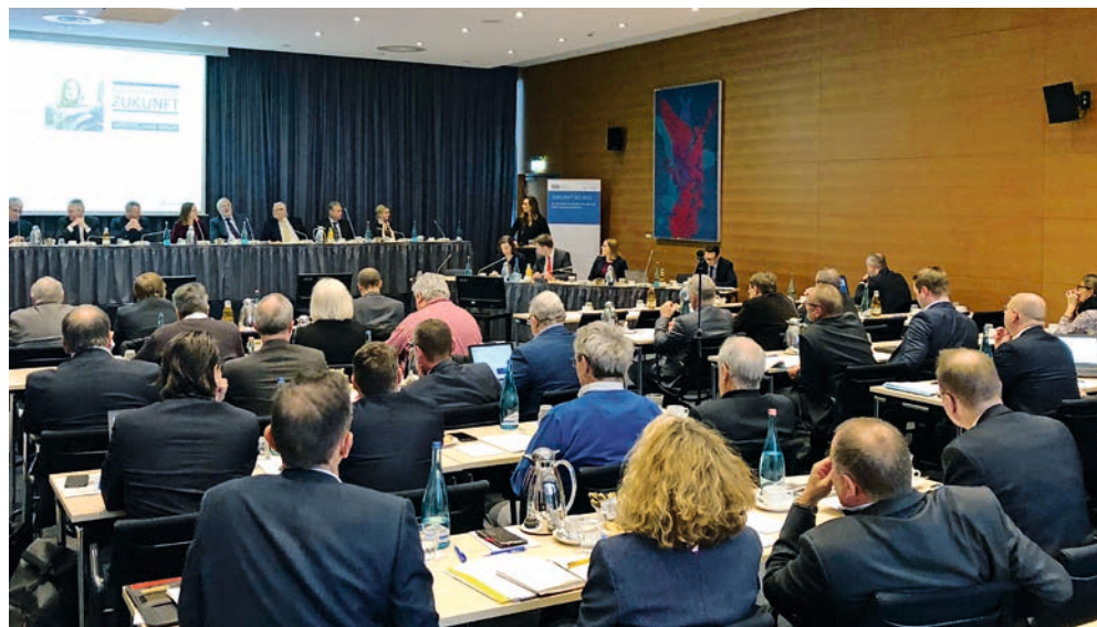
Die bdo-Mitgliederversammlung beschloss konkrete Schritte gegen den Fahrermangel in der Branche

Die bisherige Festlegung auf Deutsch passe, so das Plenum, nicht mehr in eine international vernetzte Welt mit europäischem Binnenmarkt und grenzüberschreitenden Verkehren. Eine Umkehr sei dringend angezeigt. Sie würde nicht nur mehr Menschen neue Berufschancen eröffnen, sondern auch ein wirksames Instrument im Kampf gegen den Nachwuchsmangel in der