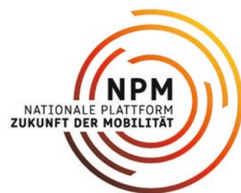
Bei der NPM geht es für den bdo unter anderem um die Frage: Wie kann der Bus noch besser mit anderen Verkehrsträgern vernetzt werden?

Ein wichtiges Forum für ein zentrales Thema unserer Zeit. Um den Wandel der Mobilität in Deutschland zu gestalten, hat die Bundesregierung die Nationale Plattform „Zukunft der Mobilität“ (NPM) einberufen. Ziel ist die Entwicklung von verkehrsträgerübergreifenden und -verknüpfenden Pfaden für ein weitgehend treibhausgasneutrales und umweltfreundliches Verkehrssystem, das eine „effiziente, hochwertige, flexible, verfügbare, sichere, resiliente und bezahlbare Mobilität“ ermöglicht. Der bdo wird daran mitarbeiten, dies möglichst zu machen. Dafür wurde der Verband von Verkehrsminister Scheuer in die NPM berufen.