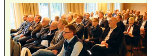
Volle Reihen und großes Interesse bei den NWO-Bezirksversammlungen im November

Regen Zuspruch fanden die diesjährigen NWO-Bezirksversammlungen. Insgesamt machten sich gut 150 Teilnehmer auf den Weg zu den beiden Veranstaltungen. Im Michael Schumacher Kart & Event Center in Kerpen tagten die rheinischen Bezirke Düsseldorf und Köln gemeinsam, während die westfälischen Bezirke Detmold, Münster und Arnsberg sich im Hotel Freischütz in Schwerte versammelten. Die Entwicklungen im ÖPNV, die im kommenden Jahr anstehende Tarifrunde mit Verdi und neue Regelungen im grenzüberschreitenden Verkehr standen auf der Tagesordnung.